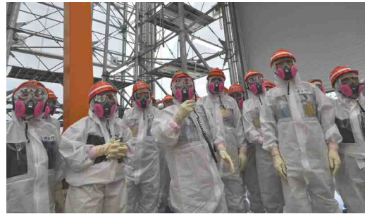
ALPS建屋の中で説明を受ける調査団(同上)

汚染水対策では、第一 原発の地下水バイパスに ついて、基準を超えるト リウム検出が続く井戸 を閉鎖し、希釈して海へ 放出することは許されな いと指摘しました。