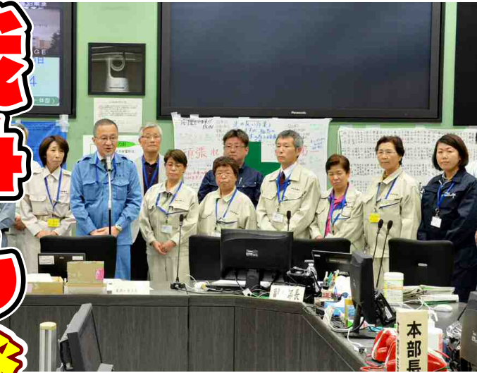
免震重要棟で挨拶する笠井亮衆院議員と党県議団。 (2014年5月19日・福島第一原発)