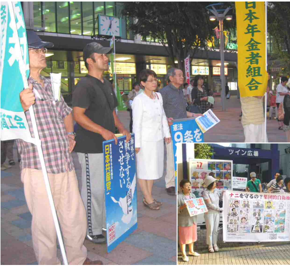
解釈改憲に反対し9条守れと県内各地で市民が集会を開催した。 (写真は郡山駅前と福島駅前の行動の様子)