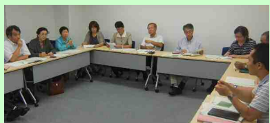
環境省への要請（7月4日=福島市）